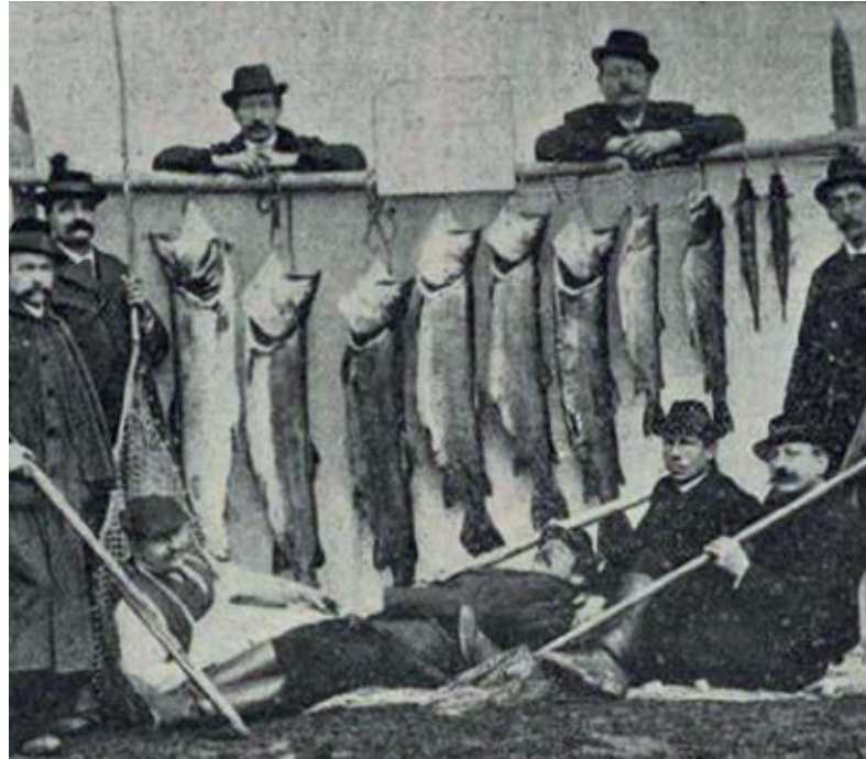
Diese Huchen wurden Opfer eines Fischsterbens in der Enns in Österreich

Der Fang von Huchen ist heute sehr stark kontrolliert: Ausgedehnte Schonzeiten, ein Schonmaß von 90 cm und Fangbeschränkungen (in vielen Vereinen darf ein Angler pro Jahr in der Regel maximal einen Huchen fangen). Diese Hegemaßnahmen wurden von Fischern initiiert und umgesetzt. Die Fischer setzen sich auch für die Verbesserung des Lebensraums und der Laichplätze und die Nachzucht der Art ein. Ihnen ist es zu verdanken, dass Hucho hucho bis heute in vielen Flüssen Bayerns vorkommt.